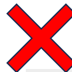
ダボダボしたもの