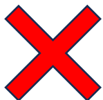
デザインの入ったもの